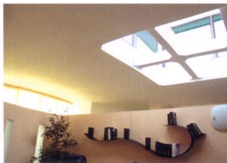
F&N Ufficio System, azienda leader nel mercato del software gestionale dalla fine degli anni '80